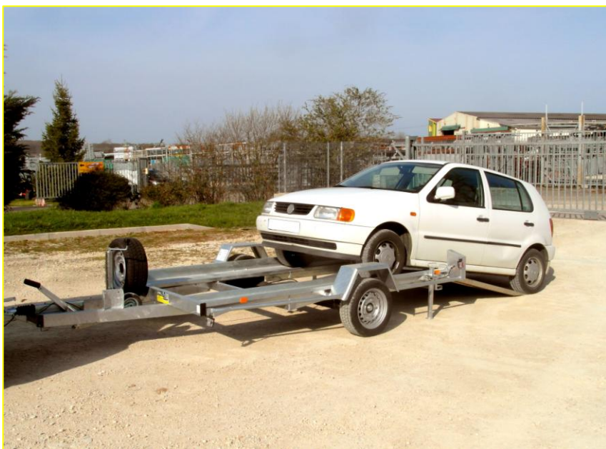
MODELE 25 PV 45