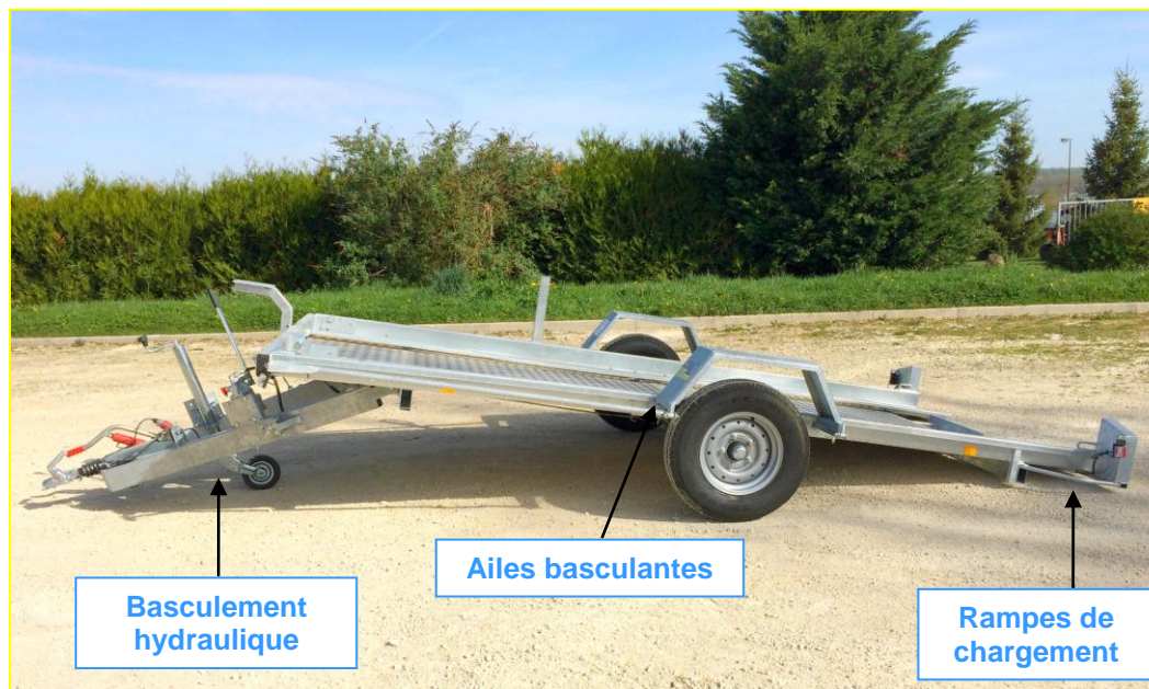
MODELE 13 PV 40