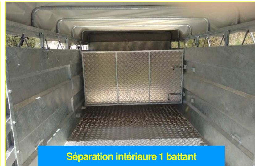
Séparation intérieure 1 battant