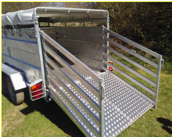
Barrières de chargement portefeuille