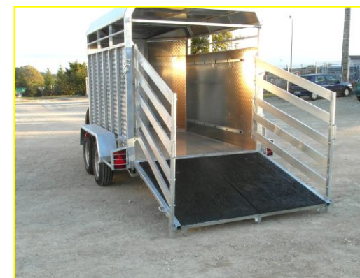
↪ Barrières latérales de chargement