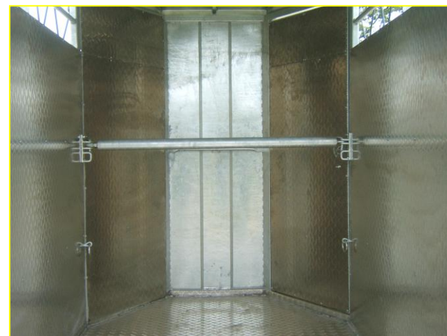
↪ Barre de poitrail