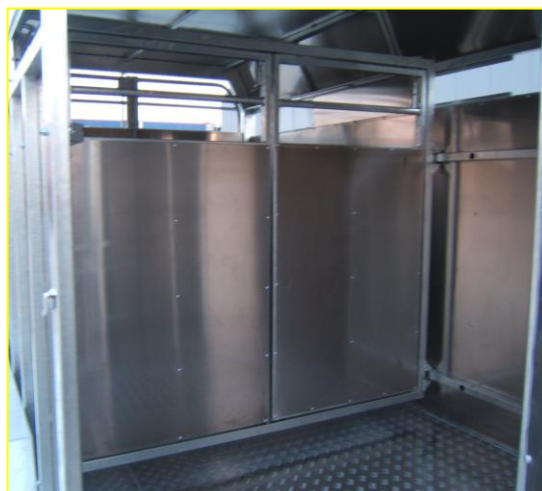
↪ Séparation intérieure sur rail