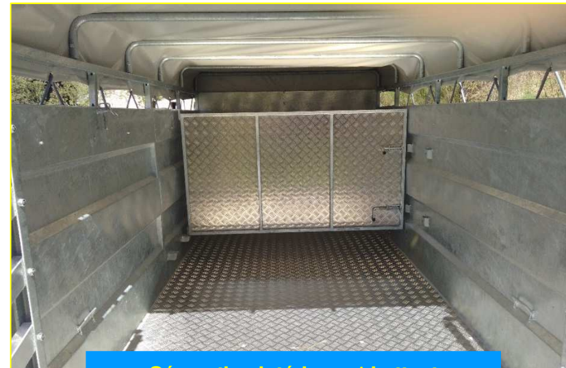
Séparation intérieure 1 battant