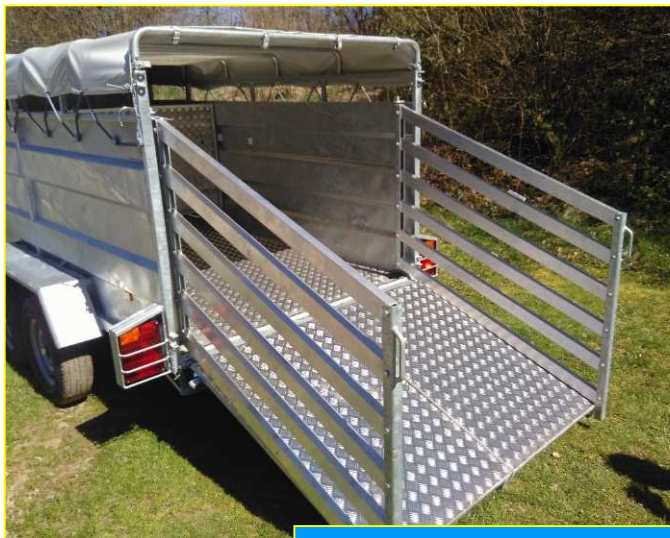
Barrières de chargement portefeuille